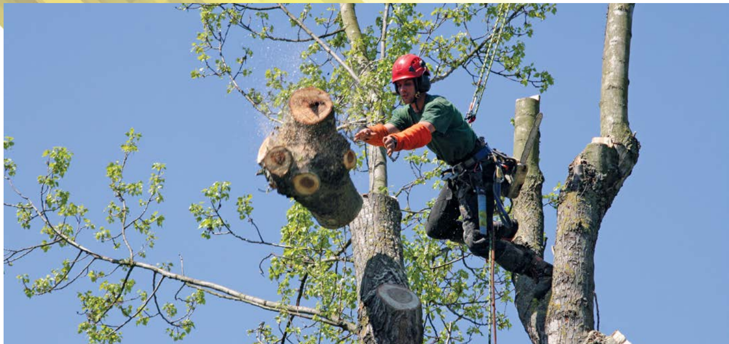
Démontage d'un peuplier. Strasbourg

Créée en 1989, l'entreprise Schott Elagage a rejoint le groupe Holtzinger en 2012. Basée à Phalsbourg (57) et bénéficiant d'un dépôt à Wolfisheim (67), l'activité de l'entreprise s'étend à tout l'Est de la France et particulièrement en Alsace/Lorraine. L'entreprise travaille pour les particuliers, les professionnels, les villes et communautés d'agglomérations, les entreprises d'espaces verts et travaux publics, les collectivités et les administrations.