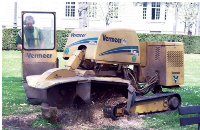
Rabotage de souche. Strasbourg

A l'ère de l'écologie, Schott Elagage s'est rapidement imposé comme un des acteurs novateurs en matière de développement durable et de recyclage. L'entreprise s'est adaptée au marché des énergies renouvelables en retraitant intégralement les rémanents et bois issus de ses chantiers.