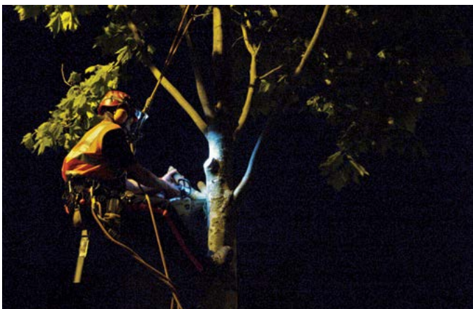
Chantier de nuit : entretien des platanes le long des voies du Tram à Strasbourg.

L'entreprise réalise également des travaux spéciaux comme la mise en place de grumes, les travaux de déboisement, de débroussaillage et de dessouchage ainsi que des interventions particulières sur des chantiers à fortes contraintes (autoroutes, lignes de tramway, de bus, réseaux ferrés, interventions de nuit, etc).